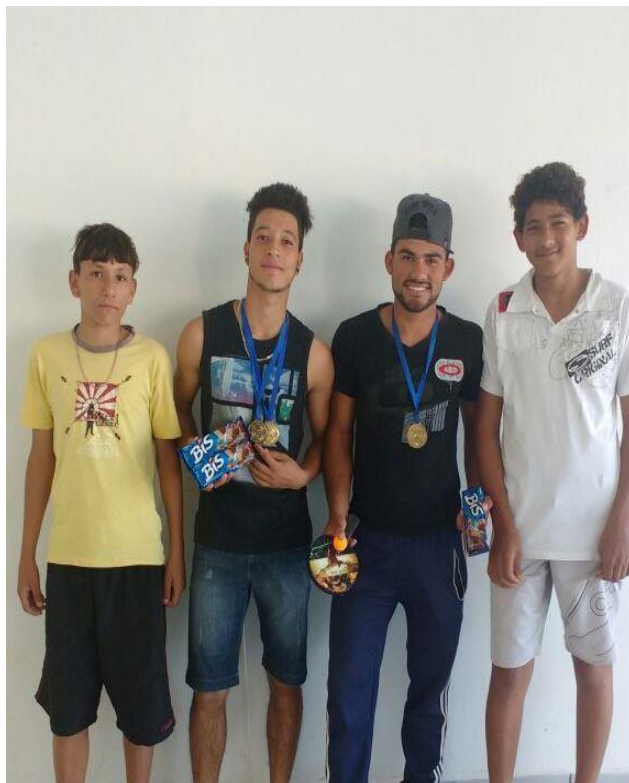
Tênis de Mesa