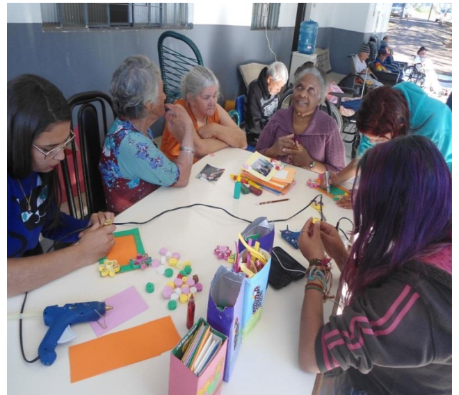
Respeitando os Idosos