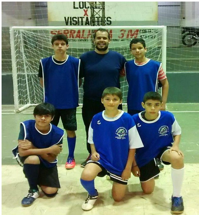
Agentes de Cidadania - Art Attack