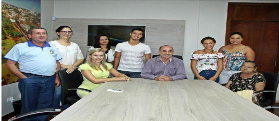
Adolescentes Aprendiz DETRAN

AÇÕES ESTRATÉGICAS DO PROGRAMA DE ERRADICAÇÃO DO TRABALHO INFANTIL Jovens APRENDIZ e a equipe do Departamento Municipal de Assistência Social foram recebidos pelo prefeito Miguel Amaral